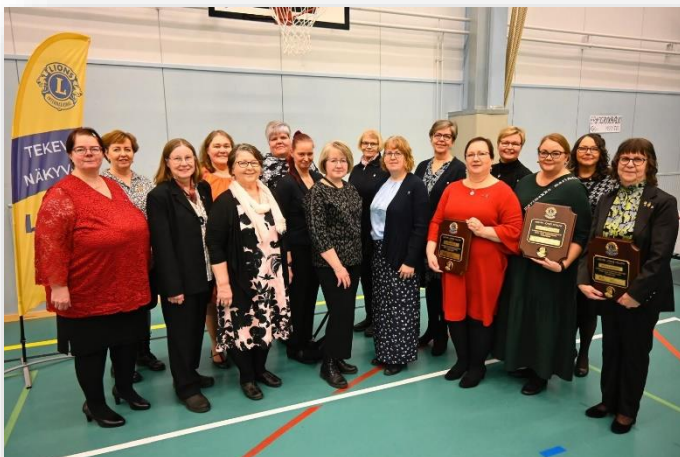
LC Punkalaidun /Fiinan jäsenistöä konsertissa.