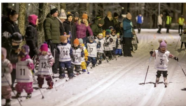
Ladun varrella riitti vipinää, sillä osallistujia oli tänä vuonna ennätysmäärä.