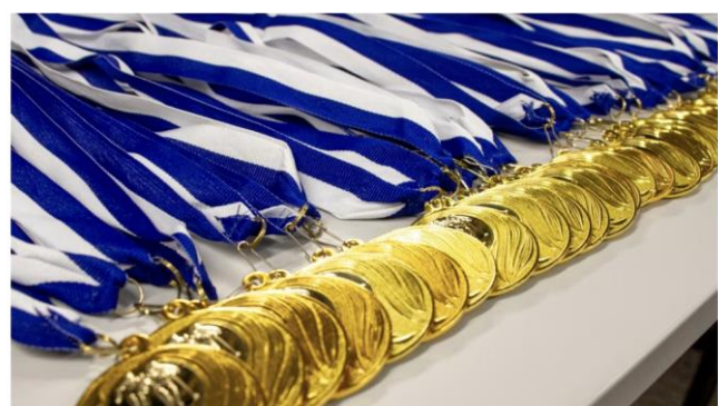
Jokainen osallistuja sai muistoksi oman mitalin.