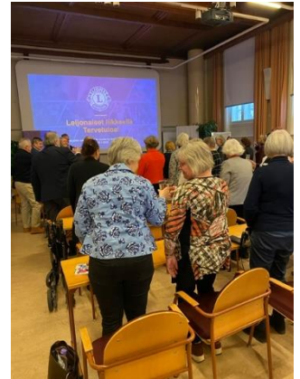
Malja 30-vuotiselle M-piirin naisleijonien taipaleelle